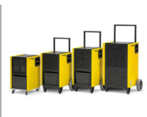
TTK-S-serie Industriële luchtontvochtigers voor permanent droog houden