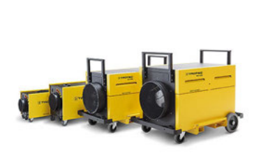
TAC-serie Luchtreinigingsapparaten Flexibel configureerbaar