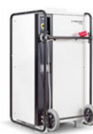
TTK 1600 Condensdroger Ontvochtigers tot 400 l/24h