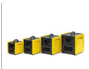
TTR-serie Adsorptieluchtontvochtigers voor laagtemperatuurzones